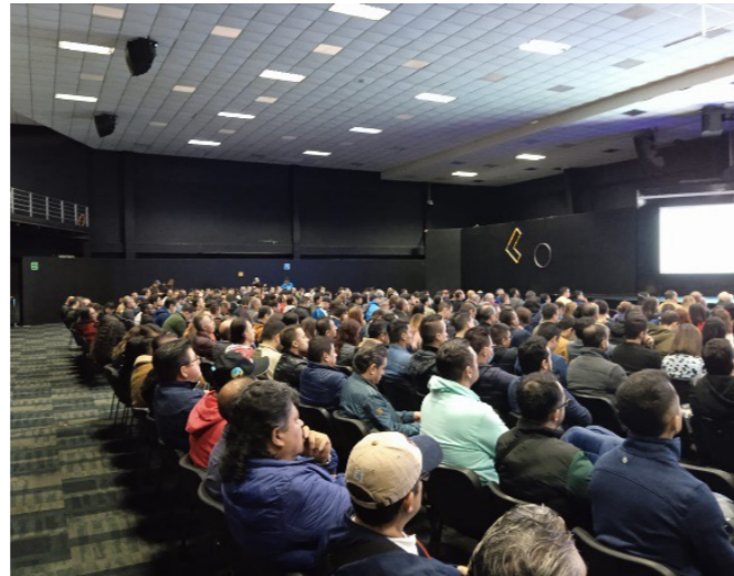
Asamblea 10 de noviembre de 2022. Aprobación del pliego

A continuación se registra en imagen algunos de los momentos históricos de este acuerdo.