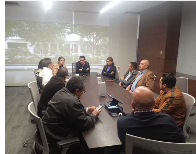
Llegando a acuerdo sindicato-empresa