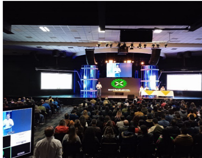
Presentación pliego de peticiones